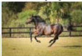
OUT OF CONTROL(BR)