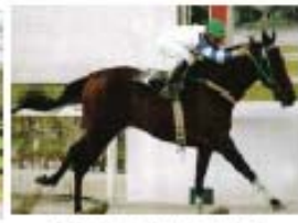
É DO SUL(BR)